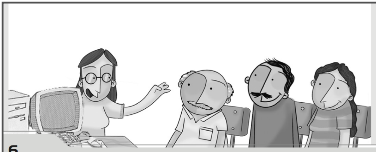
Figura 2. Una representación de la clase de computo.

En esta ilustración se ve a una instructora sentada junto a una computadora con el brazo levantado y con la boca abierta para sugerir que ella está hablando y explicando algo; los adultos se sientan en una fila sin hablar (la boca está cerrada), tienen una expresión complaciente; da la idea de que están escuchando. Ellos no están frente a una computadora para su uso, solamente la instructora tiene una y aparentemente está hablando de ella.