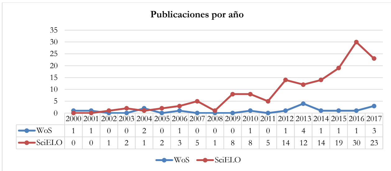
Figura 1. Publicaciones latinoamericanas de experiencia del estudiante en educación superior por año, en WoS Core Collection y SciELO Citation Index (2000-2017).

Como se puede ver en la figura1, las publicaciones tienden a aumentar hacia el final del período estudiado. Es importante mencionar que no se cuenta con datos previos a 2002 para la biblioteca de citas SciELO. WoS cuenta con un total de 17 publicaciones, y SciELO con 148.