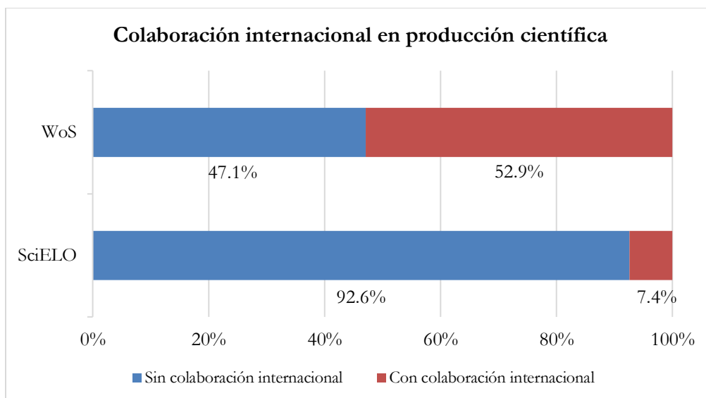
Figura 2. Colaboración internacional en la producción científica de WoS Core Collection y Scielo Citation Index (2000-2017).

En el caso de WoS, la totalidad de las publicaciones que están escritas entre investigadores de distintos países, son con países ajenos a Latinoamérica, mientras que, en SciELO, los porcentajes de colaboración internacional con países de Latinoamérica y con países de otras regiones son similares (2.7% y 4.7% respectivamente), aunque sigue primando la colaboración con países del Norte Global.